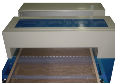
Pontes de ar frio para arrefecer peça disponíveis