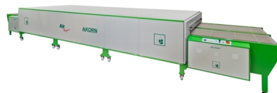
Ajuste de tapete automático em opção