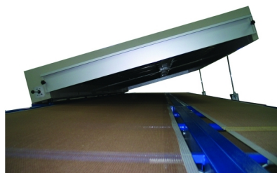
Opção de abertura lateral feita através de cilindros disponíveis