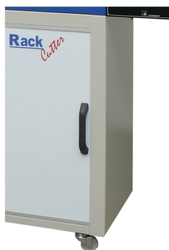
Armário na parte inferior como opção