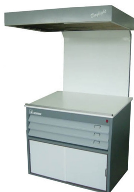
Table equipped with daylight to control printing colors available