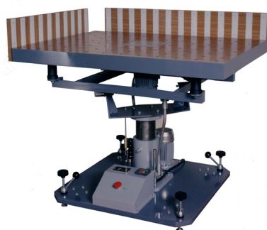
Vibrating table to organize printing sheets available

Nota: As características podem ser alteradas sem aviso prévio