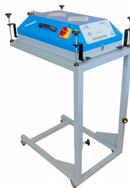
Flash com carros de transporte para máquinas MHM disponíveis