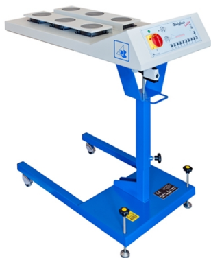
Outros tipos de flash com diversas formas disponíveis