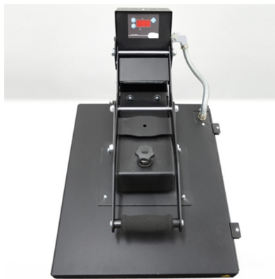
Pressure point adjustment by central point