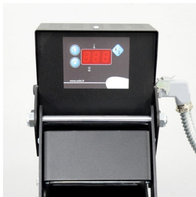
Temperature and timer digital controlled